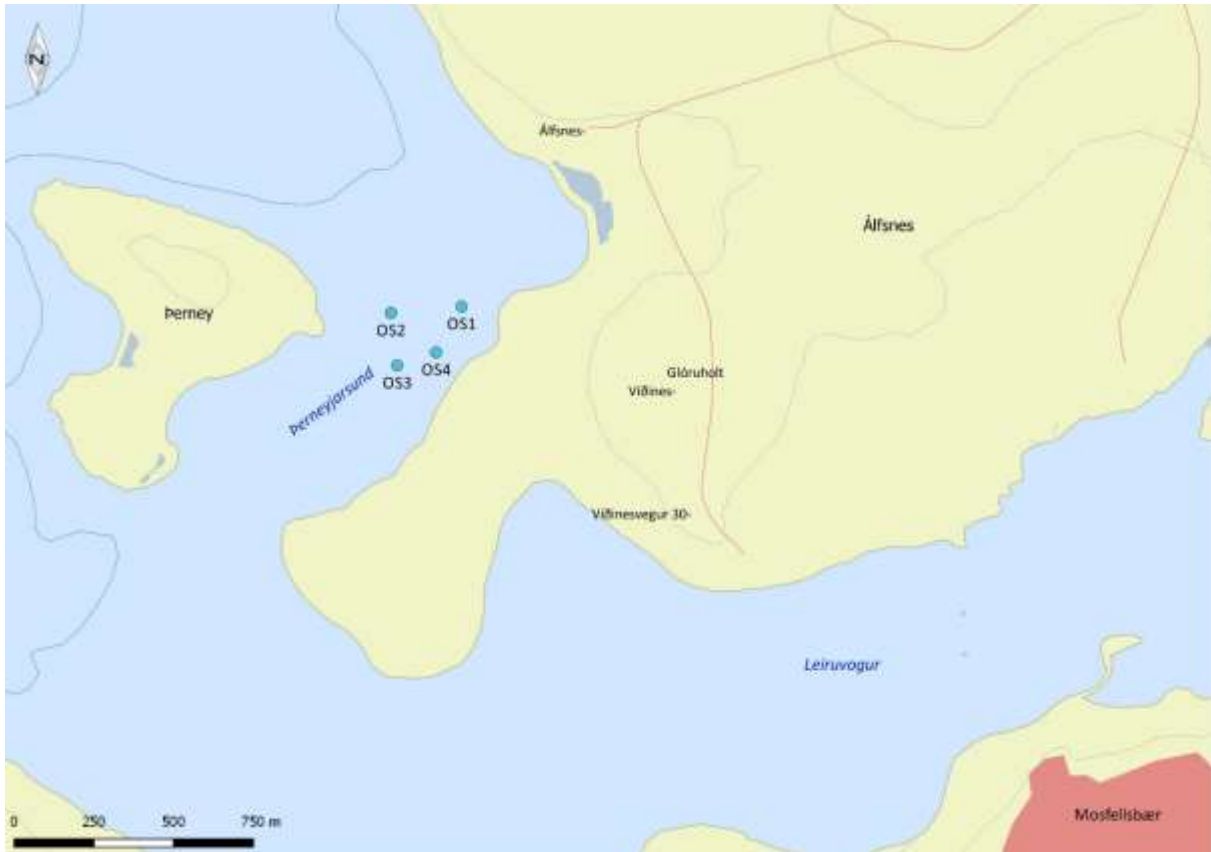
Mynd 2. Botngreipastöðvar OS1 – OS4 í Þerneyjarsundi eru sýndar með grænum hringjum.