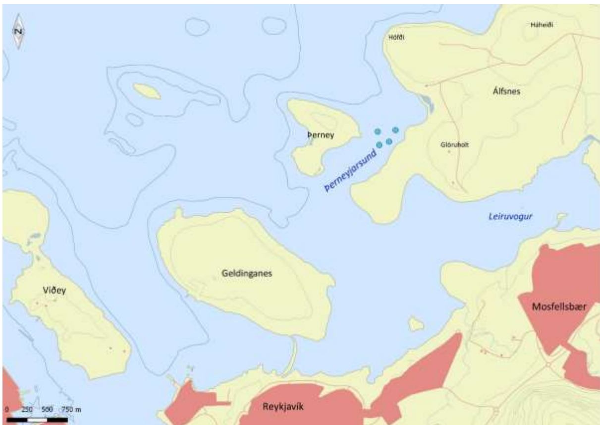
Mynd 1. Rannsóknasvæðið og nágrenni.

Björgun hyggst flytja starfsemi sína á Álfsnes og þar er fyrirhugað að gera uppfyllingu vegna bryggju og dýpka siglingaleið að henni (mynd 1). Því var ráðist í rannsóknir á botndýralífi á fyrirhuguðu framkvæmdasvæði.